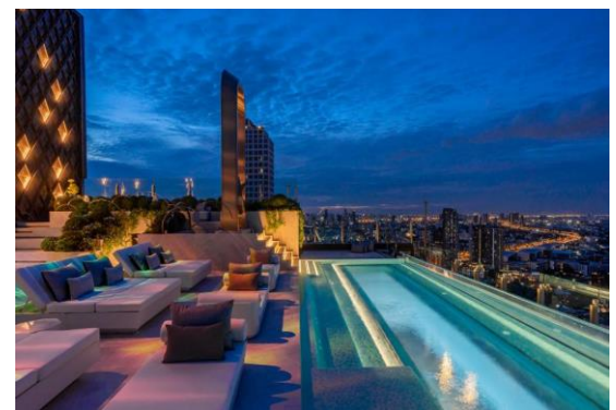
ภาพที่ 1.2-2 สภาพโครงการปัจจุบัน